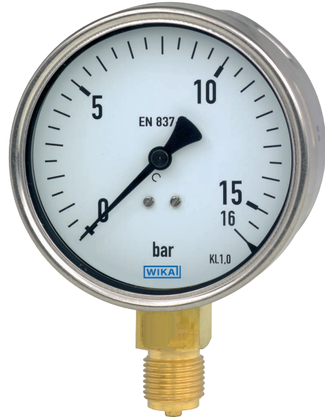
Rohrfedermanometer Typ 212.20